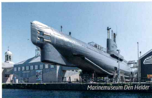
Marinemuseum Den Helder

Den Helder, een vestingstad aan zee, met een onuitwisbare en onbetwiste geschiedenis en traditie. Bezoek Den Helder en beleef cultuur in de vorm van forten, bunkers, kunst, verhalen, musea, stranden, duinen, bos, vaartochten en nog veel meer.