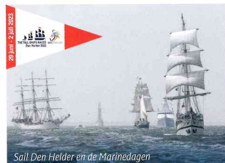
Sail Den Helder en de Marinedagen

Het nautisch evenement van 2023 vindt plaats in Den Helder. Tijdens Sail Den Helder van 29 juni t/m 2 juli doen zo'n 40 grote Tall Ships de haven van dé marinestad van Nederland aan en liggen er naast deze imposante Tall Ships ook vele andere schepen uit het Varend Erfgoed. Sail Den Helder wordt gezamenlijk georganiseerd met de Marinedagen, waar je een kijkje in de keuken van de Koninklijke Marine krijgt. Kijk voor een volledig overzicht van het toeristisch aanbod in Den Helder op www.denhelder.online .