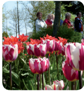
Foto- en kunstexpo Bloeiend Zijpe

Agrarisch Business Centrum BolleNoord, Groteweg 9, 't Zand. Ausstellung und Kunstexposition Dagelijks gratis te bezoeken tijdens het evenement "Bloeiend Zijpe" Täglich kostenlos zu besichtigen während "Bloeiend Zijpe"